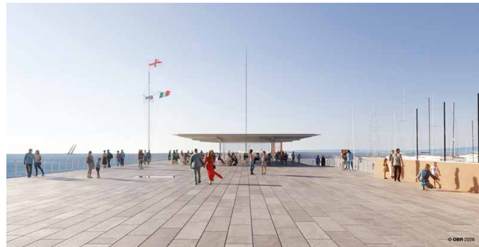
Casa Vela, centro della Federazione Italiana Vela. Render del progetto.