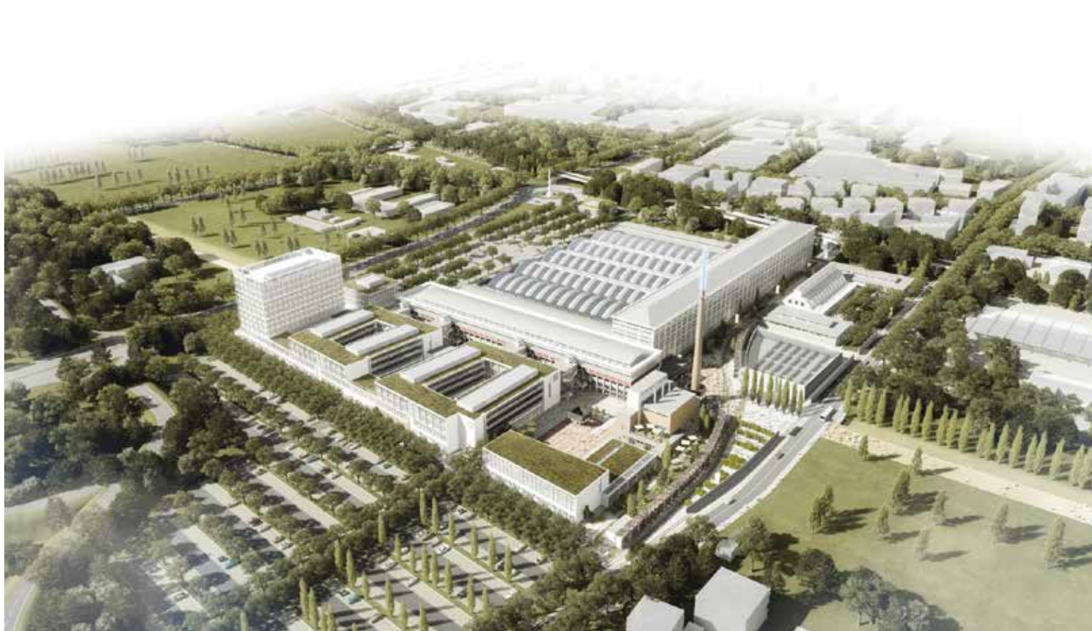
Progetto del Tecnopolo di Bologna.