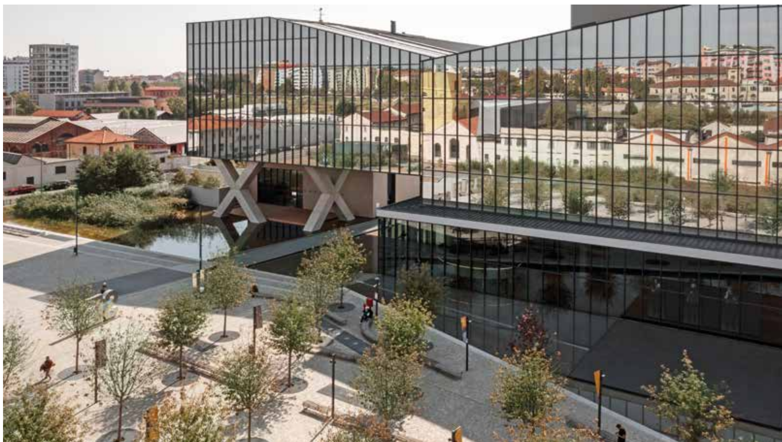
Fastweb Hq nel quartiere Symbiosis a Milano.