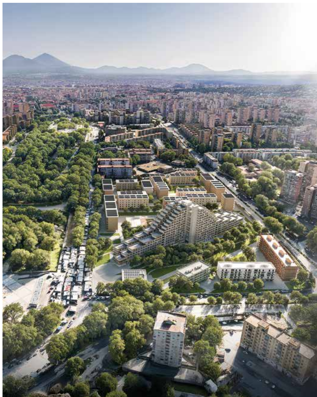
ReStart Scampia. Render.

3 _ Uno dei progetti a cui stiamo lavorando è ReStart Scampia , il più grande intervento di rigenerazione urbana di Napoli. Comporta la demolizione della Vela Gialla e Rossa, la riqualificazione della Vela Celeste e la realizzazione di nuovi edifici residenziali energeticamente auto efficienti. Attorno sorgerà un ecoquartiere con parco pubblico, spazi per l'agricoltura urbana, servizi educativi e luoghi per la comunità. Il progetto mira a ricucire il tessuto urbano e sociale, valorizzando la storia del luogo e restituendo qualità agli spazi pubblici, insieme a nuove opportunità per i residenti.