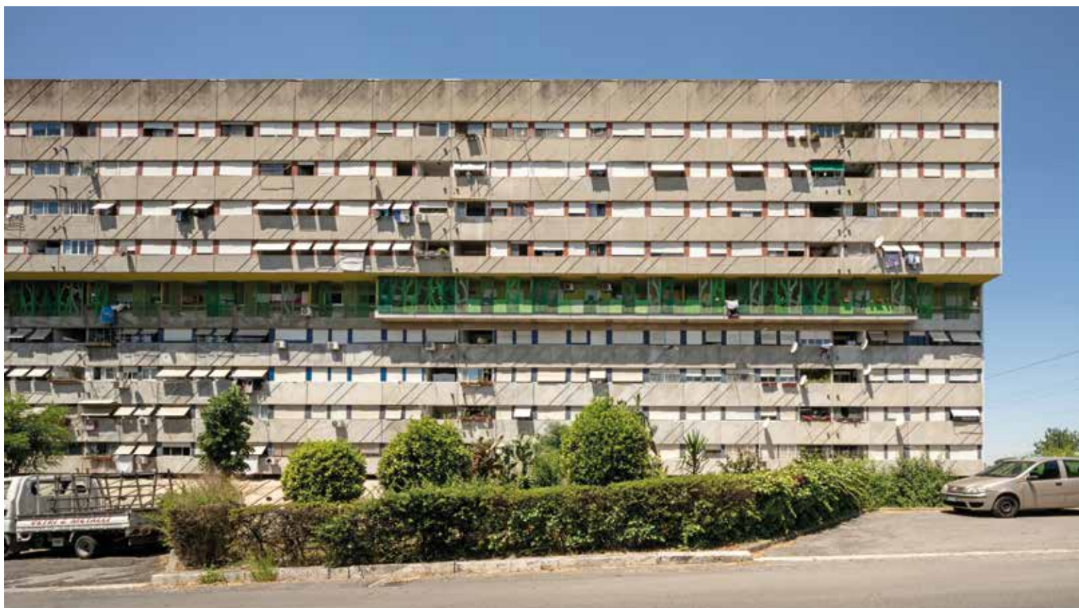
Progetto Km Verde per il Corviale. Roma.